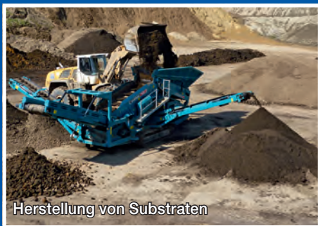
Herstellung von Substraten