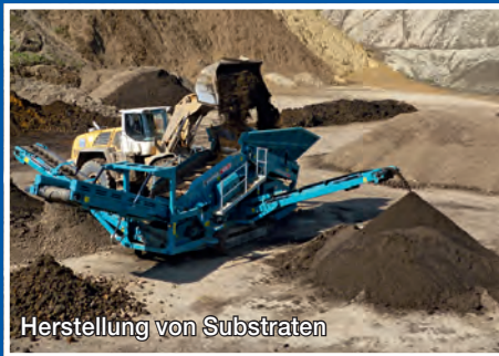
Herstellung von Substraten