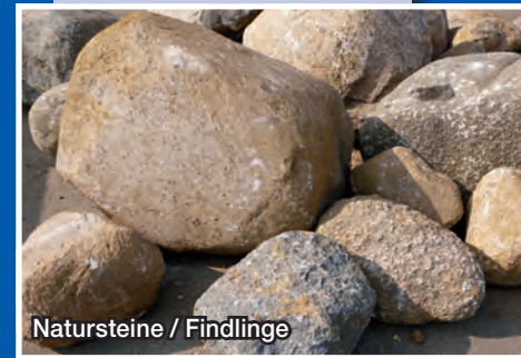
Natursteine / Findlinge